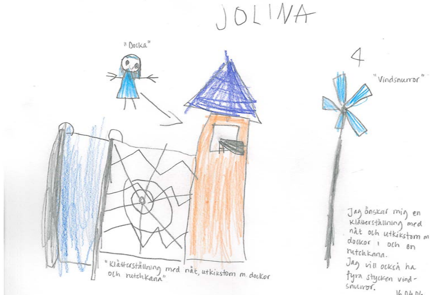
Figur 6. Jolina tycker att det bör finnas fyra vindsnurror på lekplatsen.

På fråga 2 (Hur tycker du att lekplatserna i Nykvarn är?) visar svaren tydligt att ju yngre barnen är desto roligare upplever de att Nykvarns lekplatser är.