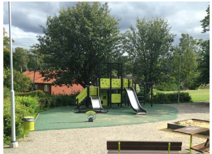
Figur 4. Områdeslekplatsen Gammelorp stora.

Lekplats med ett större utbud av lekutrustning, anpassad för barn i åldern 1-10 år. Lekplatsen fungerar som samlingsplats för områdets barn och även som utflyktsmål för närliggande förskolor. Antalet områdeslekplatser i en kommun beror på antalet orter och storleken på dessa. Exempel på utrustning är gungor, vippgungor, rutschkana, klätterlek och sandlåda.