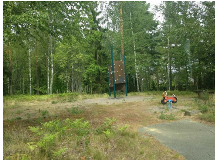
Figur 2. Lekplatsen Åsby 3 är inte tillgänglighetsanpassad.

Den 4 december 2008 beslutade regeringen att Sverige ska följa Barnkonventionens protokoll om rättigheter för personer med funktionsnedsättningar. Detta innebär att all offentlig miljö, inklusive lekplatser, ska vara tillgänglighetsanpassad. I Nykvarns kommun uppfyller få av våra närområdeslekplatser kraven på tillgänglighetsanpassning. Detta innebär att barn med funktionshinder inte erbjuds de lekmiljöer som de faktiskt är berättigade till enligt regeringens beslut.