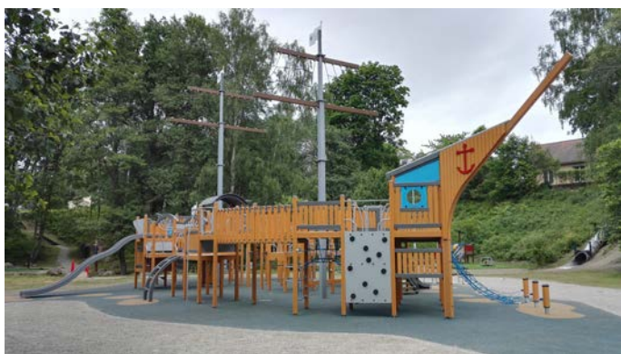
Figur 3. Klätterskepp i Källparken.