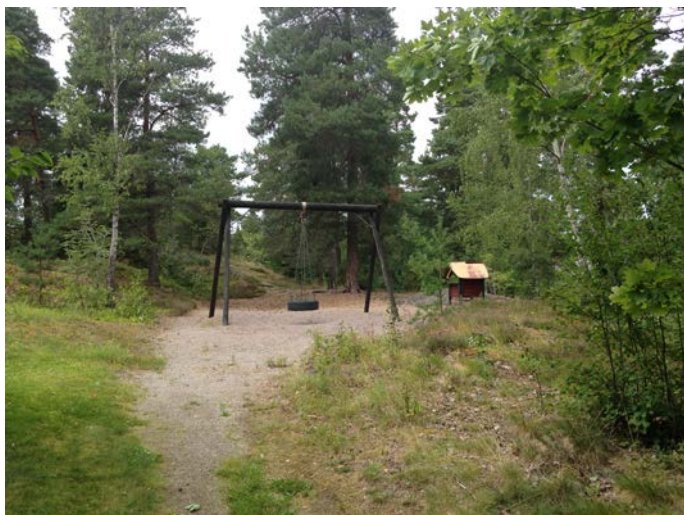
Figur 12. Lekplatsen Nibble rustas upp.

Samtliga kvarvarande lekplatser, med undantag av Källparken och Gammeltorp stora, rustas under perioden 2017-2025 upp för att uppfylla kriterierna för områdeslekplats. Det bör ske i två faser där kommunen under åren 2017-2020 i första hand säkerställer att befintlig utrustning uppfyller måtten för säkerhet. I de fall lekredskapen anses uttjänta ska de bytas ut och kompletteras för att lekplatsen ska uppnå en standard med vad som kan betecknas som ett basutbud för en mindre, tillgänglighetsanpassad lekplats. Vid val av ny lekutrustning ska hänsyn tas till planerad framtida utformning av respektive lekplats. Samtliga lekplatser kompletteras med soffor, bord och papperskorgar.