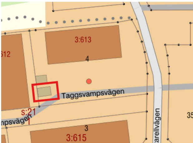
Översikt över aktuell fastighet, inom röd markering aktuell komplementbyggnad

Detta tjänsteutlåtande behandlar byggsanktionsavgift för uppförande av komplementbyggnad (leveransbyggnad) area 27,28 kvadratmeter, utan startbesked.