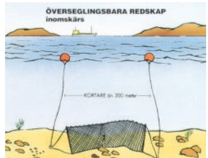
Överseglingsbara redskap som är kortare än 300 meter ska utmärkas med en fiskekula i vardera ände och fiskekulans diameter ska vara minst 15 cm. Redskap som är kortare än 50 meter kan utmärkas med endast en fiskekula som i diameter ska vara minst 15 cm, eller en cylinder som ska vara minst 20 cm lång och 6 cm i diameter. Fiskekula och cylinder ska vara röd, orange, gul eller vit. Överseglingsbara redskap som är längre än 300 meter ska utmärkas med vakare. Vakarens höjd ska vara minst 1,2 meter ovanför vattenytan.