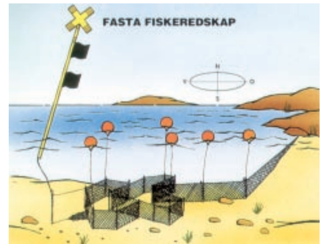
Vakare som markerar fasta redskap eller vattenbruksanläggning ska nå minst två meter ovanför vattenytan, ha ett gult kryss som toppstecken och flaggor som markerar väderstreck. (Det är förbjudet att fiska närmare än 100 meter från redskapet eller vattenbruksanläggningen.)

Här presenteras och förklaras de vanligaste typerna av utmärkning som du kan träffa på i Mälarens vatten.